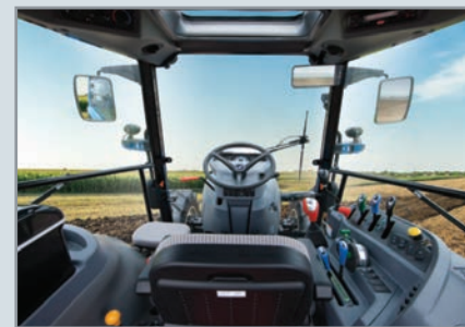
Un vaste champ de vision La conception du capot combinée à un large pare-brise et un toit ouvrant procure une vue dégagée avec un minimum d'obstruction.