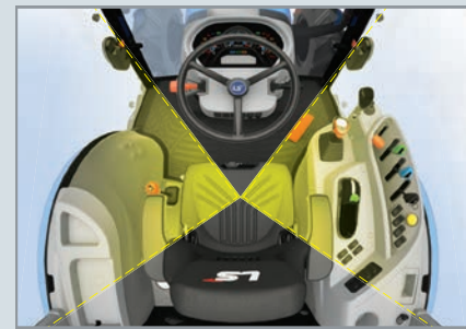
Cabine avec vue dégagée La cabine spacieuse offre une vue de 360° de la largeur de travail des accessoires attachés.