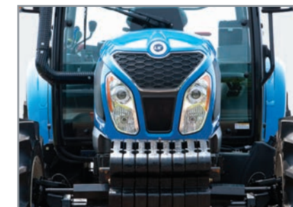
Phares nouvellement conçus La lampe de projection à haut rendement illumine même les nuits les plus sombres.