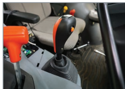
Embrayage sur levier de vitesse L'interrupteur d'embrayage sur le levier de vitesse vous permet de changer de vitesse facilement.