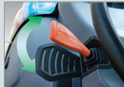
Inverseur hydraulique Changer rapidement de l'avance au reculs avec le simple mouvement d'un levier sans appuyer sur la pédale d'embrayage.