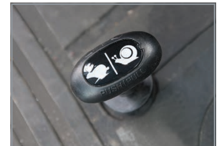
Vitesses rampantes de série Vitesse ultra lente 0.19 km/h procure de la versatilité sans coût additionnel.