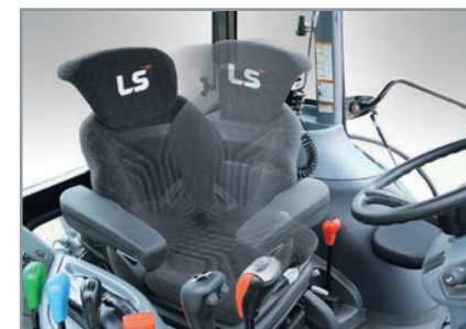
Siège deluxe Le siège à suspension à air avec pivot de 10 degrés ajoute du confort.